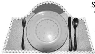
Selbst gebasteltes Tischset aus Filz

Die nebenstehende Skizze zeigt die Bastelvorlage für solch ein Tischset. Die Grundfigur ist ein gleichschenkliges Trapez ABCD mit AB \parallel CD . Der Schnittpunkt der beiden Diagonalen [AC] und [BD] ist der Punkt E . Die „Ausschnidelinie“ verläuft entlang dreier Kreisbögen.